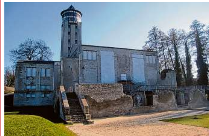
In der ehemaligen Turbinenhalle trifft Geschichte auf Kreativität und Inspiration.