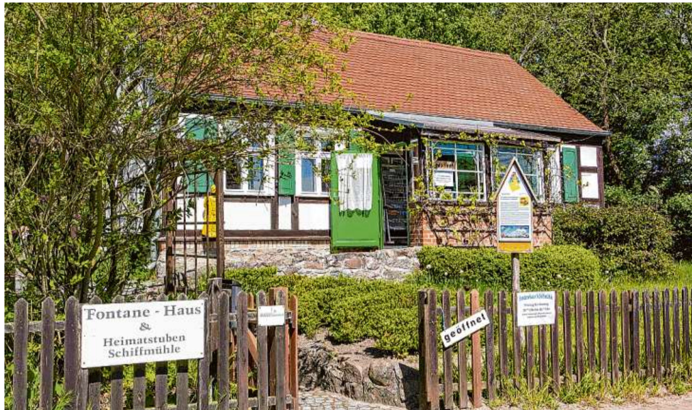
Den Wegweisern des Theodor-Fontane-Radweges folgend kommt man zum Ortsteil Schiffmühle, wo das „Fontanehaus“ steht.

Die flache, weite Landschaft im Osten Brandenburgs ist bestens mit dem Fahrrad zu erkunden